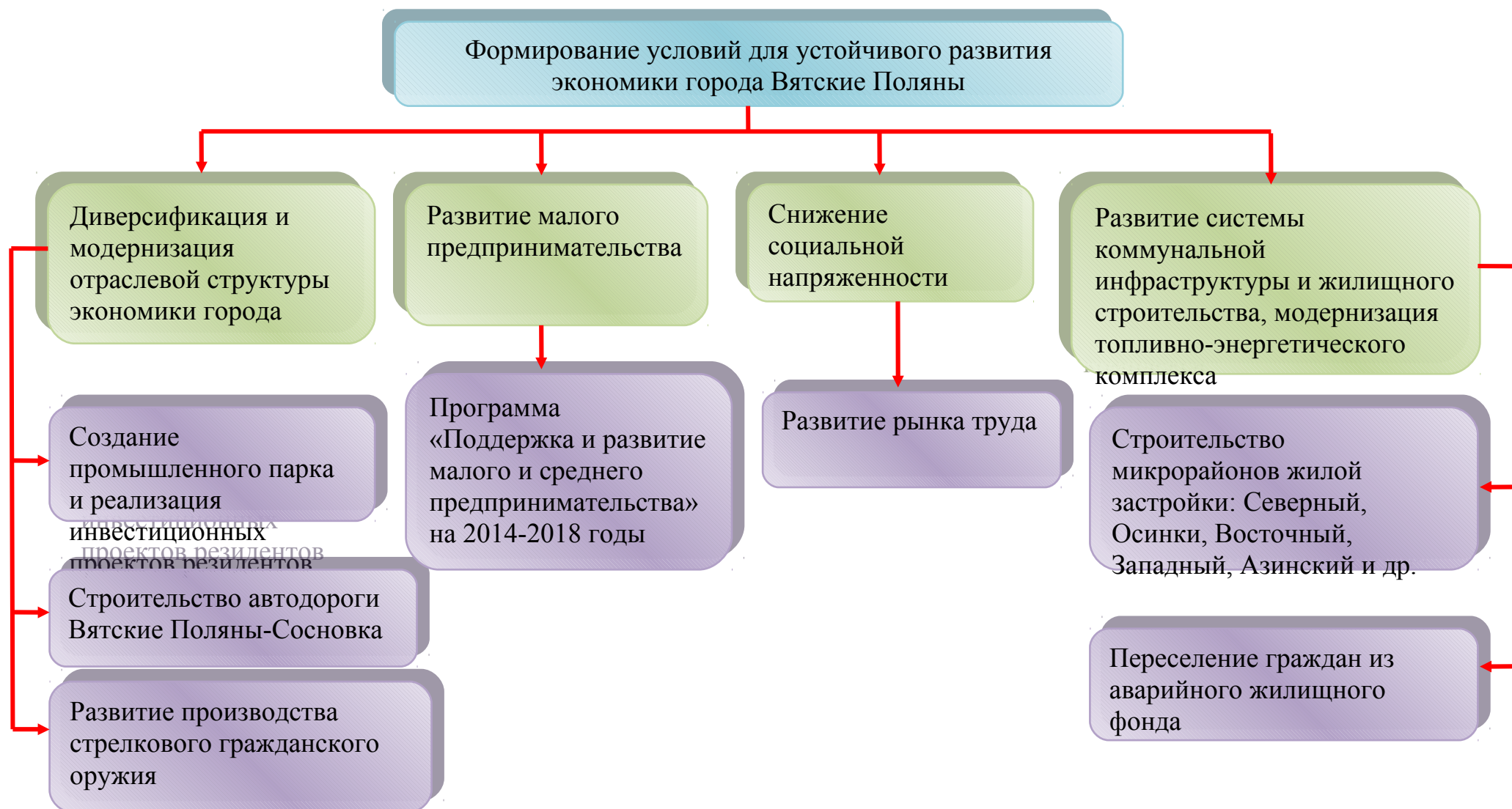
Рис. 4. Дерево целей КИП: цель (1 уровень); задачи (2 уровень); мероприятия (3 уровень)