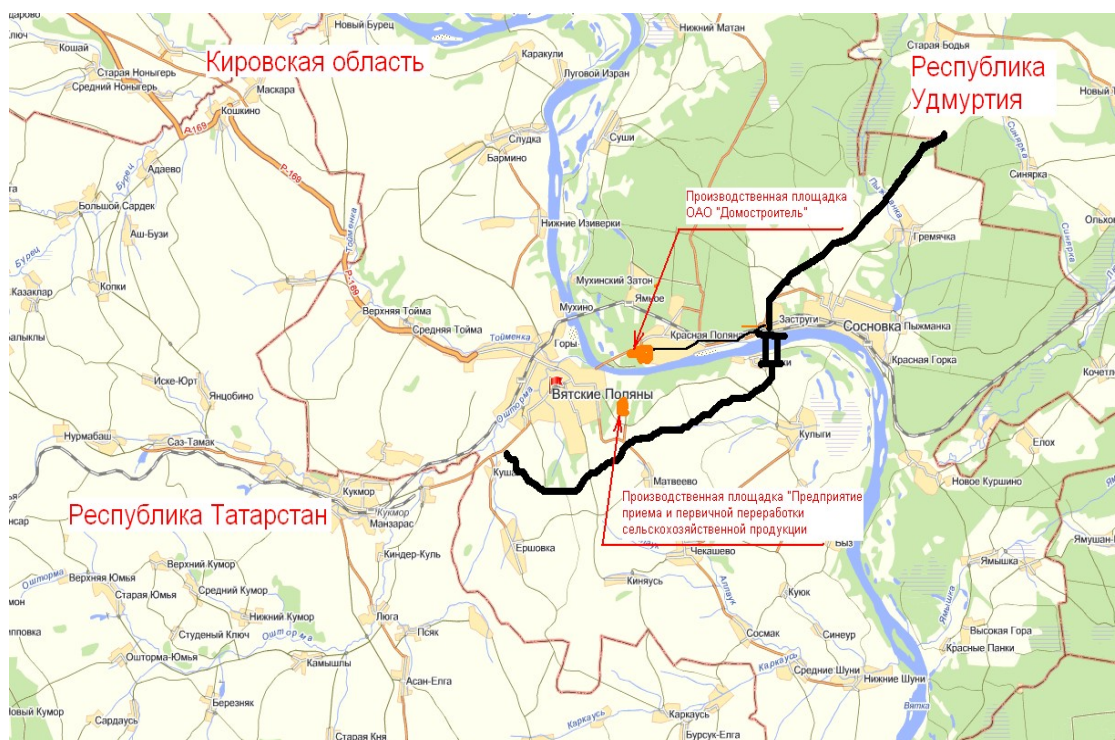
Рис. 3. Схема дороги и размещения крупных инвестиционных проектов

привлекательность промышленного парка, обеспечивая доступ к материальным ресурсам, а также позволит снизить транспортные издержки и затраты времени на перевозки, окажет содействие в освоении новых территорий и ресурсов.